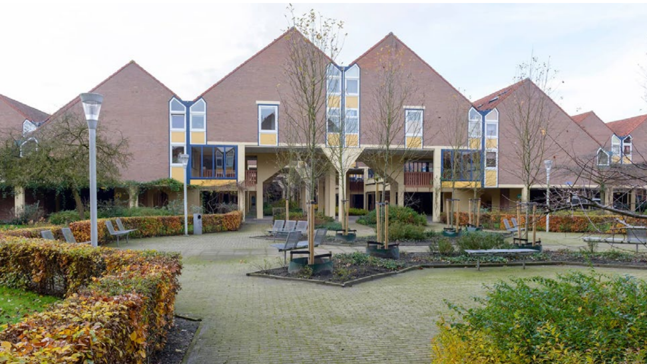
Wooncomplex De Kasbah in Hengelo dat is voorgedragen als een Post 65-rijksmonument.