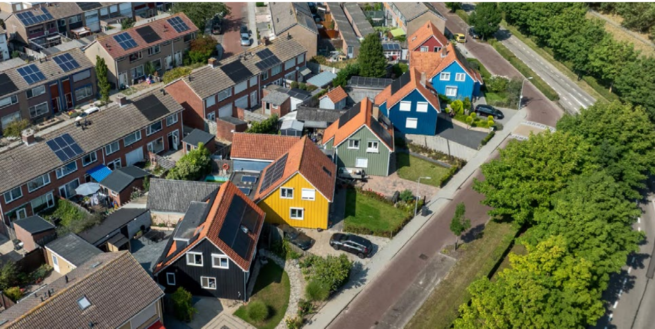
Houten prefab-woningen die kort na de Watersnoodramp door onder meer Noorwegen, Zweden, Finland en Oostenrijk zijn geschonken aan Nederland.