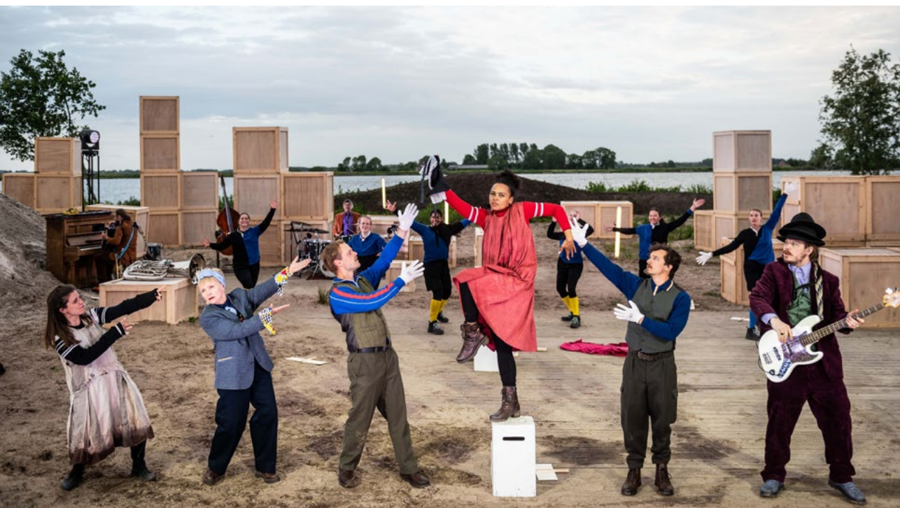
De Raad voor Cultuur is aanwezig bij de openlucht muziektheatervoorstelling De revolutie van de Rinsema's . Het stuk speelt zich af tegen het decor van de zandafgraving in Nij Beets (Fryslân).