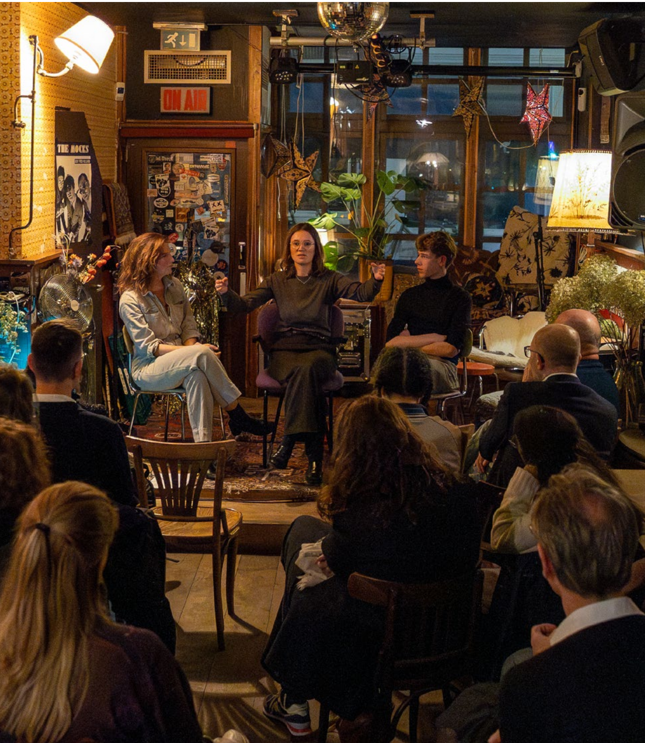
De Raad voor Cultuur praat met makers over talentontwikkeling in Zeeland.